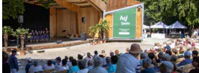
Sonntag, 11.06.2023 – Chorfestival auf der Freilichtbühne Spremberg

07.05. 15:00–19:00 Uhr Tanzkaffee – Tanznachmittag mit So Alleinunterhalter für Junggebliebene MGZ Bergschlösschen, Bergstraße 11 Veranstalter/Partner: Stiftung SPI, NL Brandenburg, MGZ Bergschlösschen Einlass 14:00 Uhr, Eintritt: 10,00 €, Vor Anmeldung erwünscht, Telefon 03563 2395