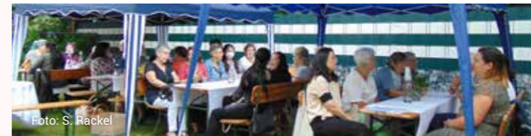
Veranstaltung im Hofgarten an der Villa der Volkssolidarität

03.06. 09:00–12:00 Uhr DANCE FACTORY Sommershow Sa Revanas Dance Factory, Otto-von-Guericke-Str. 15 Eintritt frei