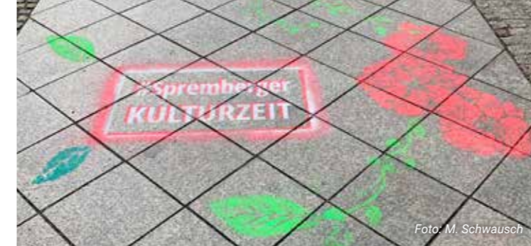
ab 03.05. Straßenkunst auf dem Gehweg der Langen Straße